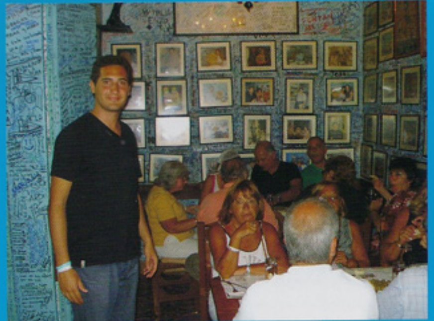
Bodeguita del Medio