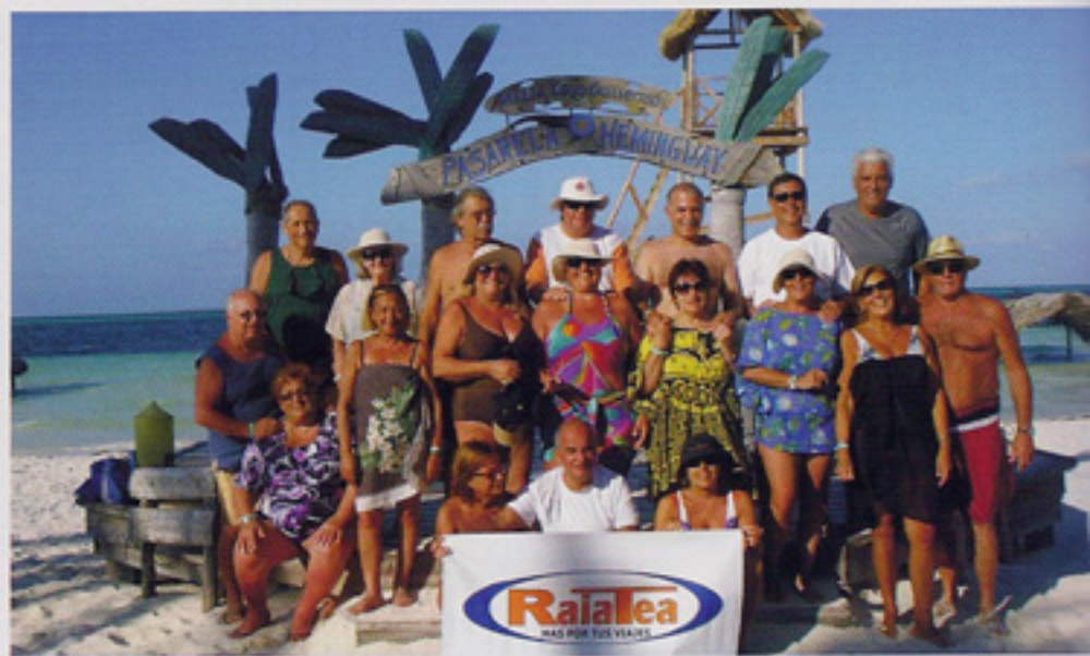
Foto grupal en Cayo Guillermo, Pasarela Hemingway

largo del día como Yoga, Aqua Gym, Clases de Baile, Voley en la Piscina, etc. Y por las noches pudimos disfrutar de muy buenos espectáculos en el anfiteatro brindados por el grupo de baile del Meliá Cayo Guillermo. Para los que gustan de la noche el hotel ofrece una discoteca luego del teatro, aunque muy pocas personas acudían a la misma.