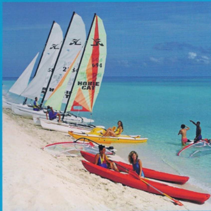
Playa Hotel Meliá Cayo Santa María