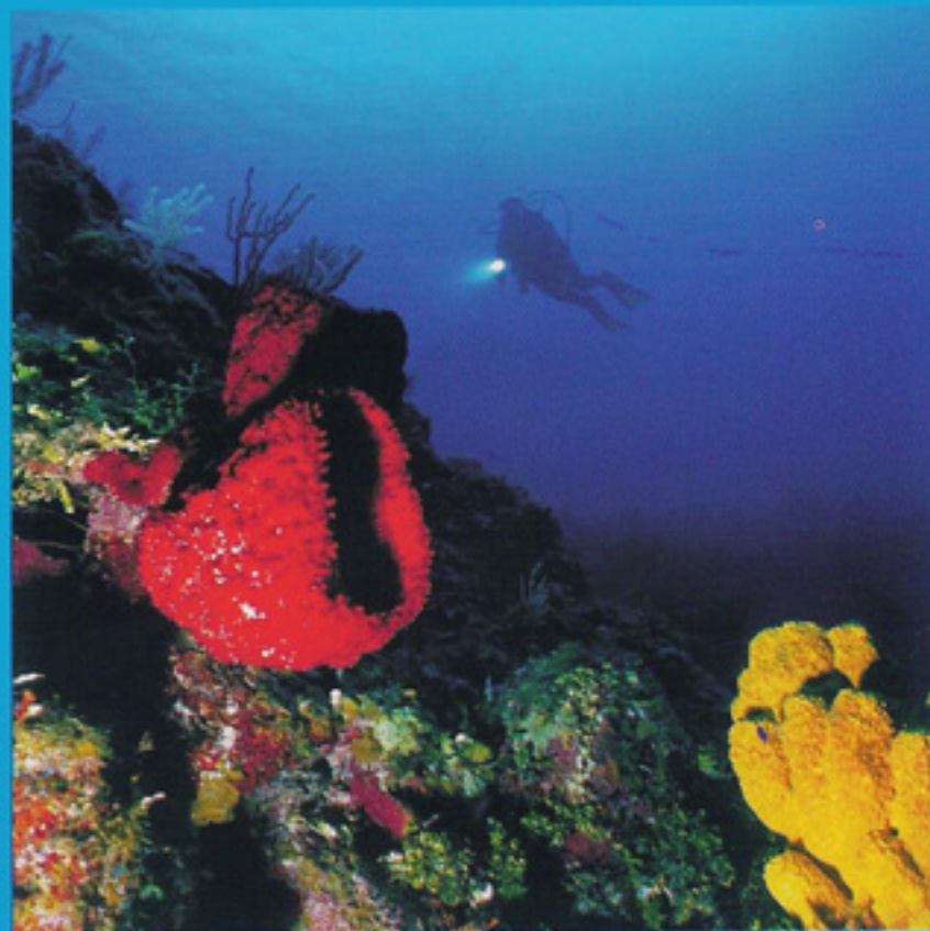
Buceo en arrecifes de Cuba

Nos alojamos en el Hotel Meliá Cayo Guillermo. Dentro de las actividades que ofrece el Cayo podemos mencionar las que se desarrollan en los arrecifes de coral que se encuentran cercano a la costa y se puede acceder mediante excursiones contratadas en la