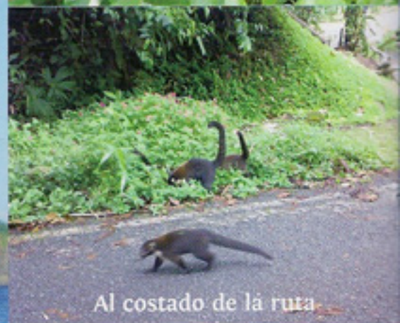
Al costado de la ruta