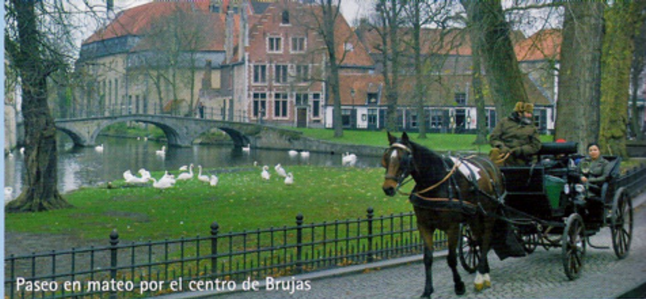
Paseo en mateo por el centro de Brujas