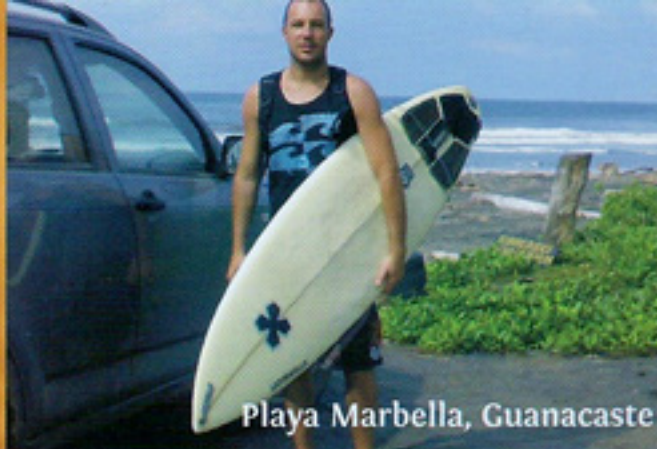
Playa Marbella, Guanacaste

Luego de dos días en el parque nacional, tomamos temprano la ruta, para hacer uno de los recorridos más largos del viaje, unas 5 horas de viaje, con cruce en ferry incluido. Si bien todo el país no supera los 400 km de largo. El viajar en sí es una aventura. En esta parte del recorrido no se necesita de la doble tracción, pero si estuvo muy acertada la amortiguación y la altura de la camioneta, para soportar los baches en el camino, sobretodo luego de cruzar en ferry el Golfo de