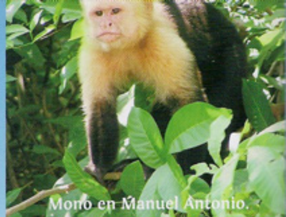
Mono en Manuel Antonio.