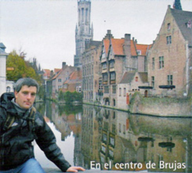
En el centro de Brujas