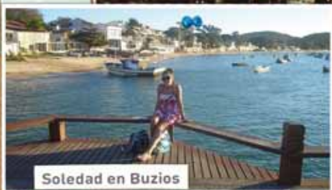
Soledad en Buzios