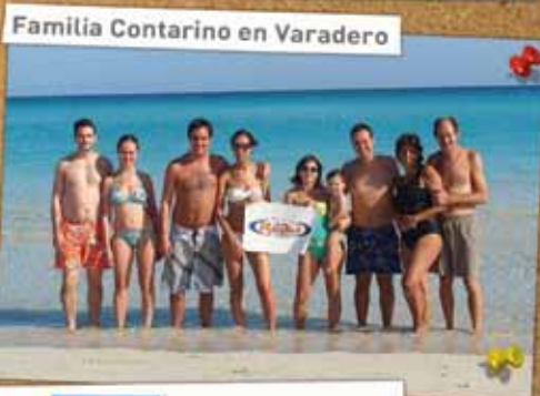
Familia Contarino en Varadero

Hacete fan de YO VIAJÉ POR RAÍATEA en facebook y subi tus fotos. Podes ser parte de nuestra revista!!!